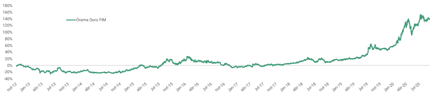
Gráfico de Performance